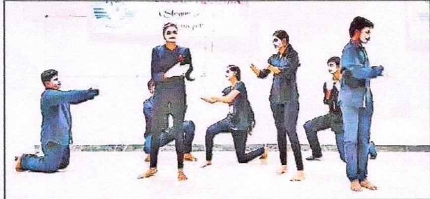
విద్యార్థుల మూకాభినయం ప్రదర్శన

Date : 30/07/2019 EditionName : ANDHRA PRADESH PageNo : 01