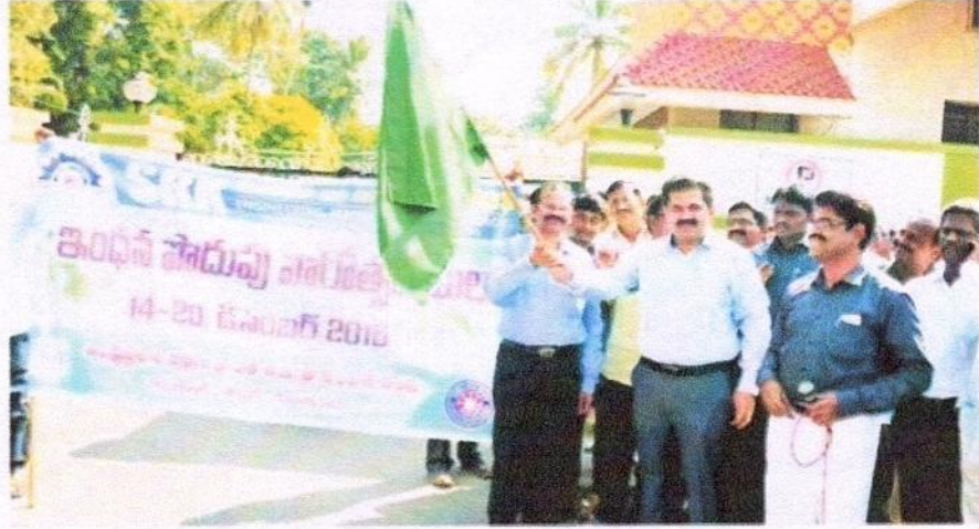
విద్యుత్ పొదుపు వారోత్సవాలను జెండా ఊపి ప్రారంభిస్తున్న కలెక్టర్ బాబు